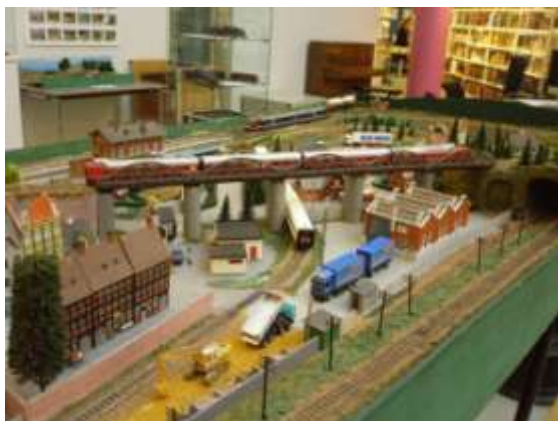
Tidligere billeder fra Viborg Central Bibliotek

Ellers er det de små detaljer der har været arbejdet med og stadig er det.